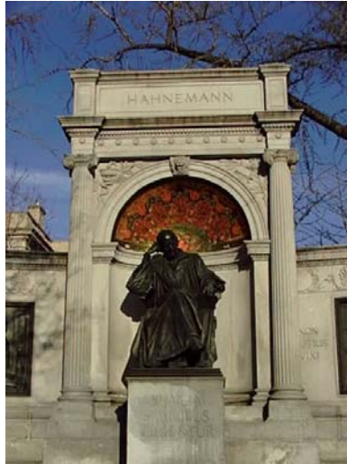
Samuel Hahnemann Memorial Massachusetts Avenue, 16th Street, NW (Scott Circle) Washington, DC

(Samuel Hahnemann, Belehrungen für den Wahrheitssucher, 1825)